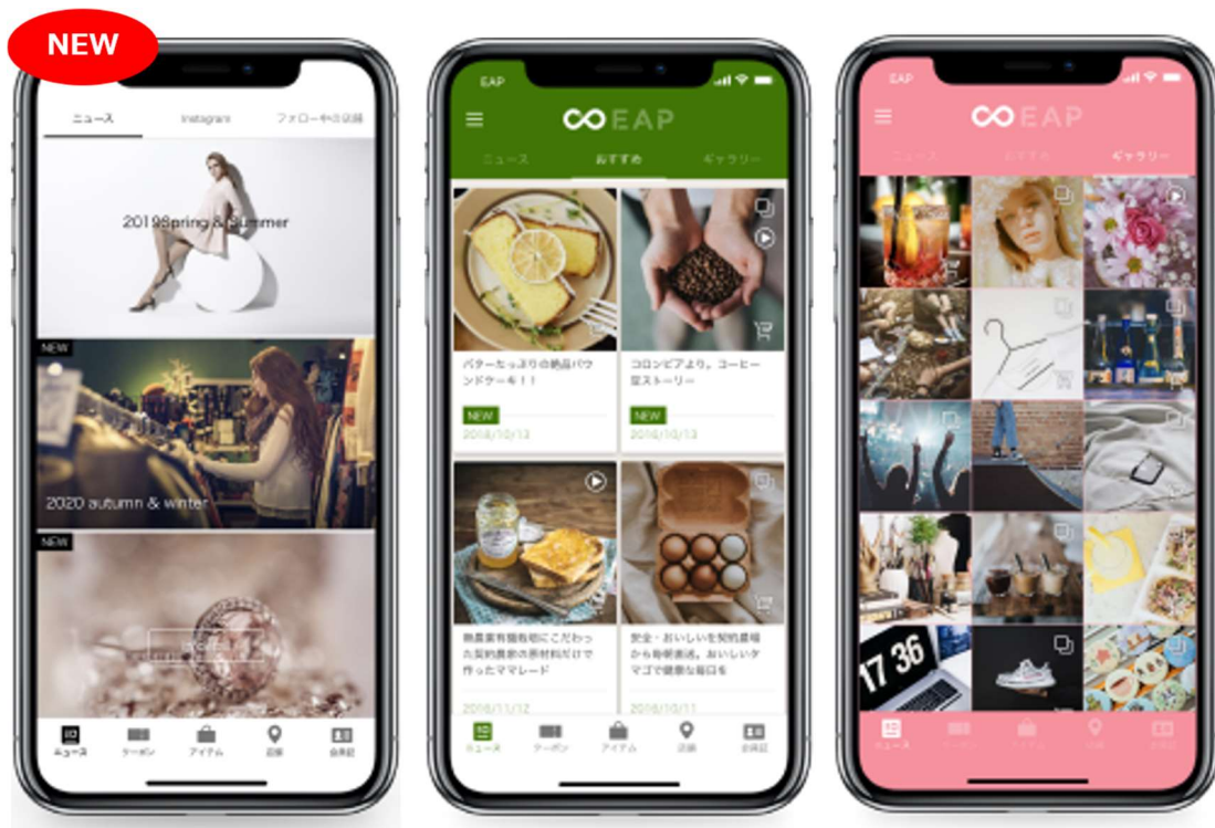
アプリ上のビジュアル表現が多様に ※左がピクチャーカード、中央、右は既存レイアウト

2017年11月にリリースした「EAP」は、会員証、店舗検索、プッシュ通知、お知らせ外部連携、ニュースレイアウトCMS化などを標準機能として持つモバイルアプリプラットフォームです。ランチェスターはお客様のご要望が多いアプリの機能を短期間かつ低コストで提供できるように今後も「EAP」のアップデートを進めて参ります。